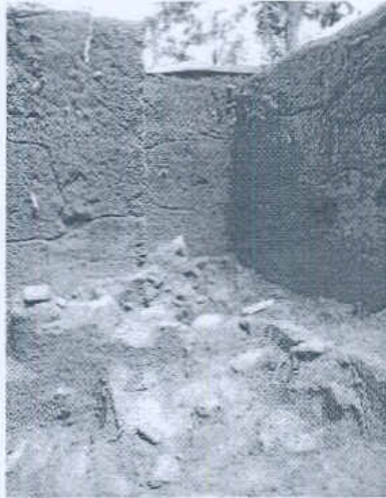
Foto 5. Extensión de la Operación donde se observa más de la Acumulación de materiales culturales en el lote 6 al fondo.