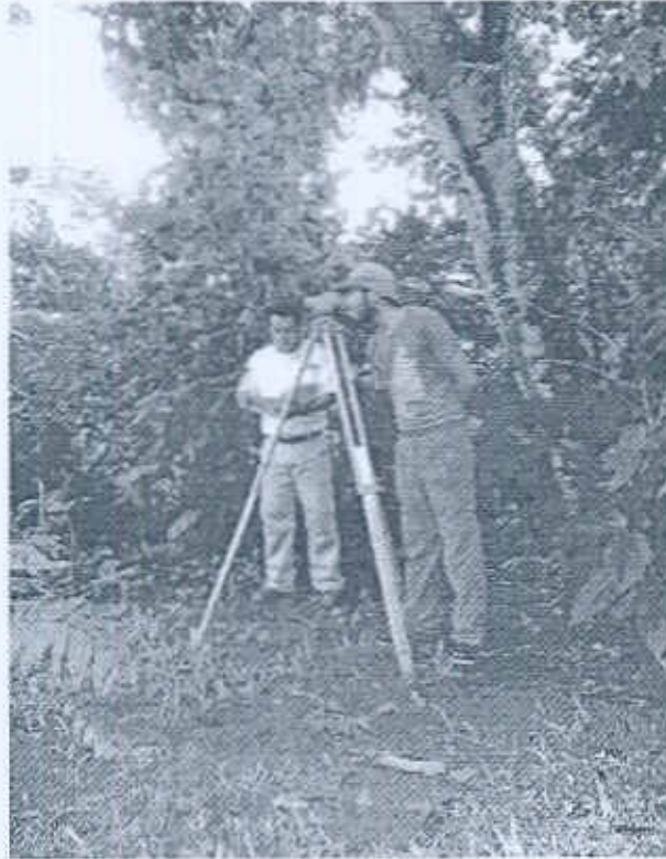
Foto 1. Ubicación y medición de la operación DD-1a.