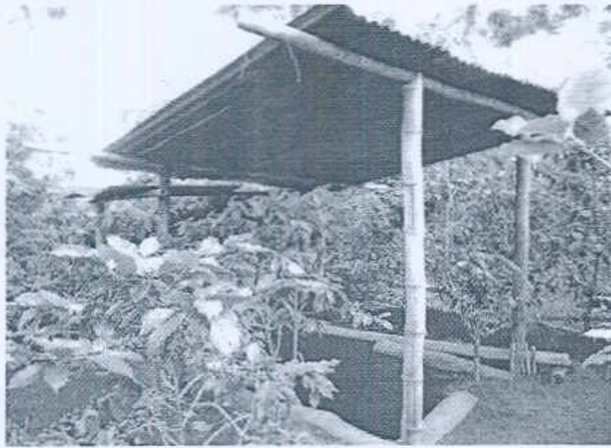
Foto 3. Galera de protección y tablas burdas a las orillas de la Operación.